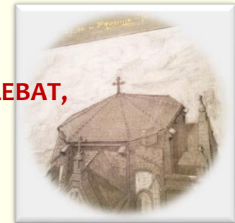
Dessin d'archive d'Auguste Callebat 4 août 1925

Octobre 1925 – novembre 1926 : reprise des travaux sous la direction d'Auguste CALLEBAT, architecte toulousain qui dessine et réalise la toiture actuelle